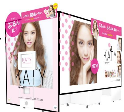
プリントシール機『KATY』 本体イメージ