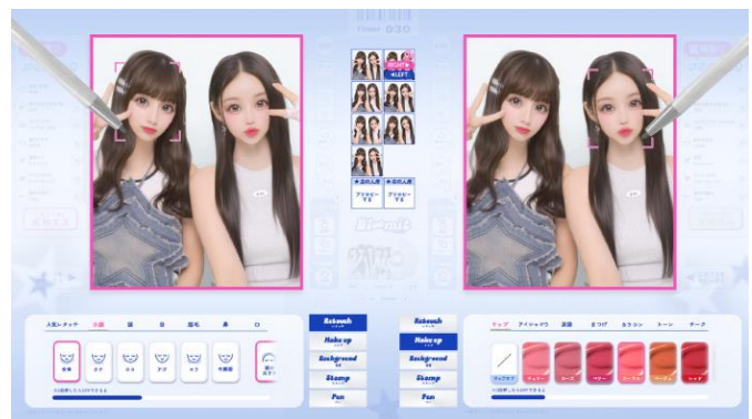
同じ画像を同時にレタッチやメイクができる 「左右同時プリ画選択」