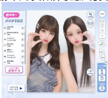
レタッチやメイクの履歴を保存して 他の画像にもワンタッチで適用できる「メイクりれき」

そして、シール自体に落書きをして唯一無二の個性をプラスできる「オソロシールカスタム」や、2人から最大8人まで同じデザインのシールがもらえる「オソロシール」も待望の新機能です。『Bloomit』は撮影からシール作成まで、プリの楽しさを最後までみんなで共有することができます。