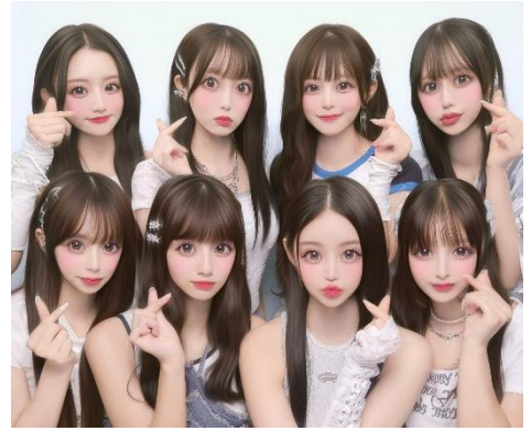
横並びでも、前後に並んでもバランスよく盛れる！

筐体内には、グループ全員にライティングが届くように天井と足元にワイドサイズのストロボを設置。さらに、前列と後列で別々の加工処理「上下加工分岐」を行うため、全員が“盛れる”環境を整えています。もし、撮影時に中心がズれてしまっても、自動で位置を調整してくれる「自動バランス補正」機能があるので安心です。『Bloomit』にはこうした“失敗しにくい仕掛け”がいくつも盛り込まれており、これから“プリ入学”をする人も安心して撮影を楽しむことができます。