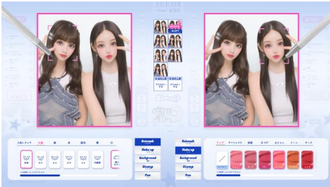
同じ画像を同時にレタッチ・メイクができるように 友達の操作を待たなくて済むので時短にもつながる

■ユーザー待望の新機能！同じ画像を同時にレタッチ・メイクができるほか、シールにも落書きできるように