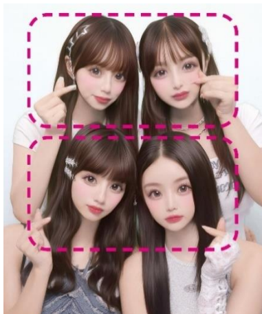
前列と後列を同じ盛れ感に処理する 「上下加工分岐」

筐体内には、グループ全員にライティングが届くように天井と足元にワイドサイズのストロボを設置。さらに、前列と後列で別々の加工処理「上下加工分岐」を行うため、全員が“盛れる”環境を整えています。もし、撮影時に中心がズれてしまっても、自動で位置を調整してくれる「自動バランス補正」機能があるので安心です。『Bloomit』にはこうした“失敗しにくい仕掛け”がいくつも盛り込まれており、これから“プリ入学”をする人も安心して撮影を楽しむことができます。