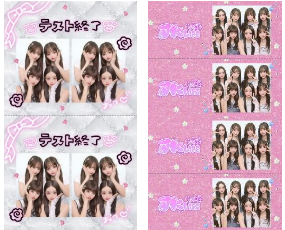
シールにも落書きができるように その日だけのオリジナルシールをみんなで共有できる