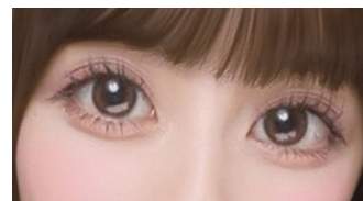
思わず目を惹く 「くりっとおめめ」