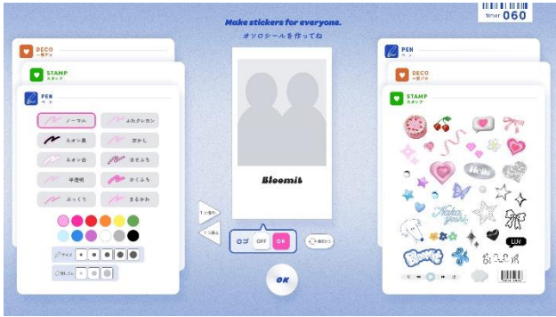
シールにスタンプやペンで落書きができる 「オソロシールカスタム」