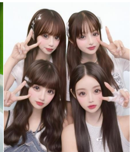
前列用の「盛れるライン」と後列用の「盛れるステップ」を使えば 顔の位置を決めやすくバランスが整ってみんなで盛れる！