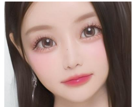
可愛さと盛れ感を演出する 「繊細ぱっちりメイク」