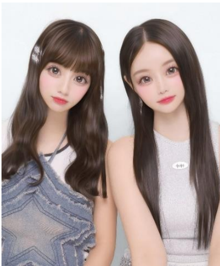
程よい加工感で自然な“さらパフ盛れ”

また、パーツバランスはやりすぎない程よい加工感で、みんなが自然に盛れるように。ふんわり広がるピンクのチークや程よいツヤ感のリップは、やわらかい肌の質感にマッチし、盛れ感と可愛さを引き立てます。