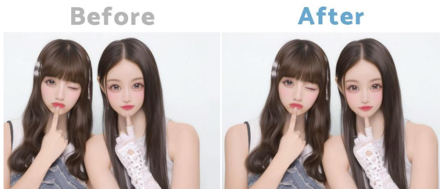
中心がズれた画像を自動で位置調整してくれる「自動バランス補正」