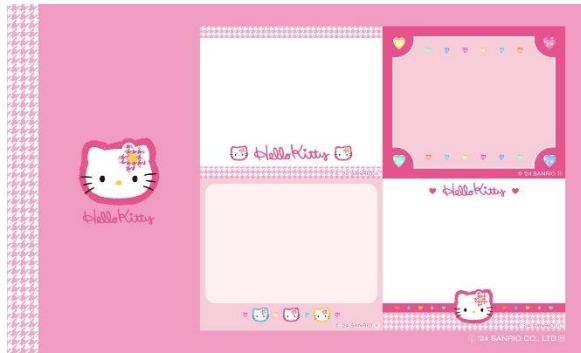
ハローキティセット