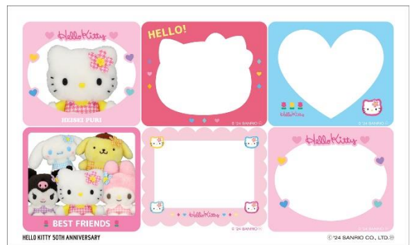
HELLO KITTY 50TH ANNIVERSARY セット