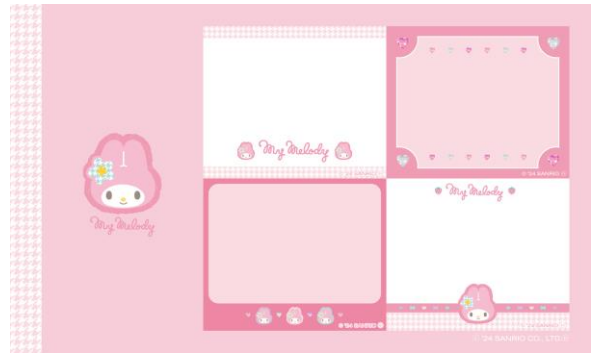
マイメロディセット