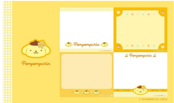
ポムポムプリンセット