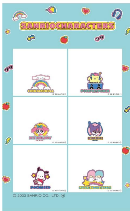
Set4: シナモロール、ポムポムプリン、マイメロディ、クロミ、ポチャッコ、リトルツインスターズ(キキ&ララ)