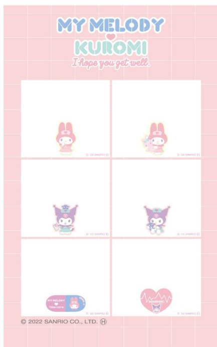
Set3: マイメロディ、クロミ