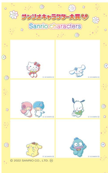
Set1: ハローキティ、シナモロール、リトルツインスターズ(キキ&ララ)、ポチャッコ、ポムポムプリン、ハンギョドン