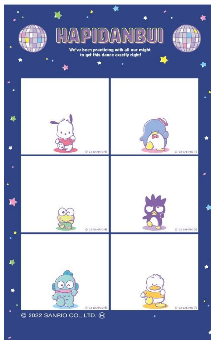
Set2: はぴだんぶい(ポチャッコ、タキシードサム、けろけろけろっぴ、パッドぱつ丸、ハンギョドン、あひるのペックル)