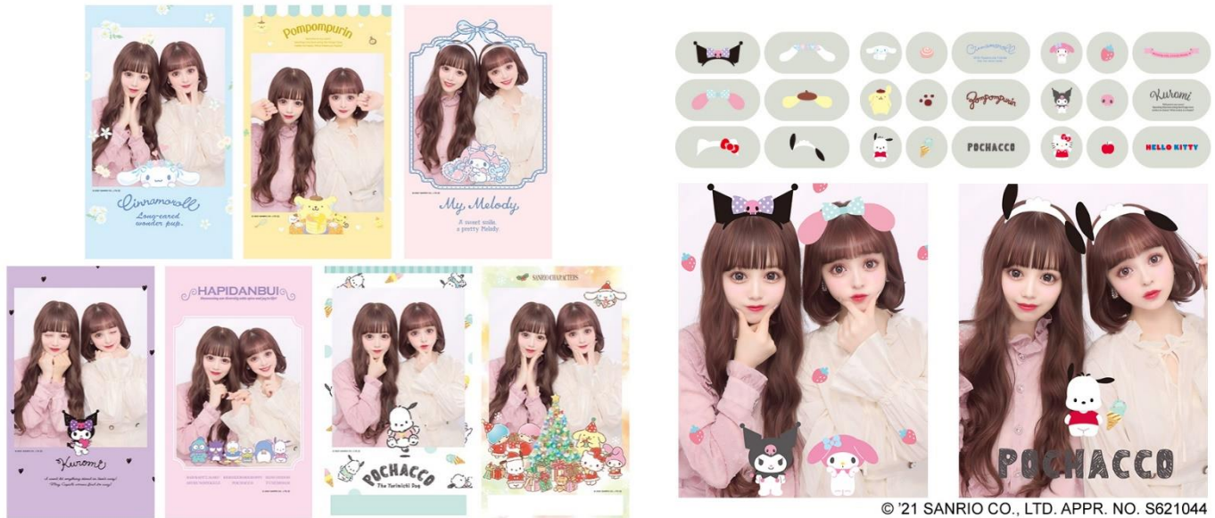
© '21 SANRIO CO., LTD. APPR. NO. S621044

サンリオキャラクターズと2022年1月10日(月・祝)までの期間限定でコラボレーション。ハローキティ、マイメロディ、クロミ、シナモロール、ポムポムプリン、ポチャッコ、はぴだんぶいと大人気キャラクターとユニットが大集結しました。全12種類のシールデザインはどのキャラクターも可愛くてついつい集めたいくなるデザインばかり。全42種類の装飾コンテンツには、キャラクターの耳がつけられるカチューシャや、セットで使いたくなるスタンプなどを搭載しています。