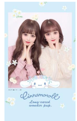
サンリオキャラクターズとコラボ

写りは、“まんまるおめめ”と柔らかな白肌が特徴。全体的にほんのりピンクテイストに仕上げ、“子うさぎ盛れ”に。レースやリボン、さくらんぼなどガーリーなデザインのシール紙や、量産型女子には欠かせないカチューシャスタンプなども必見です。