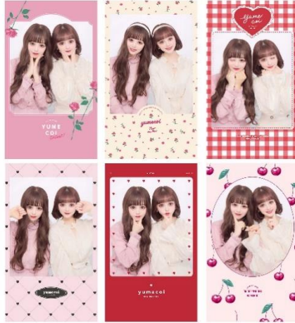
ピンク、リボン、さくらんぼなど ガーリーなシール紙デザイン