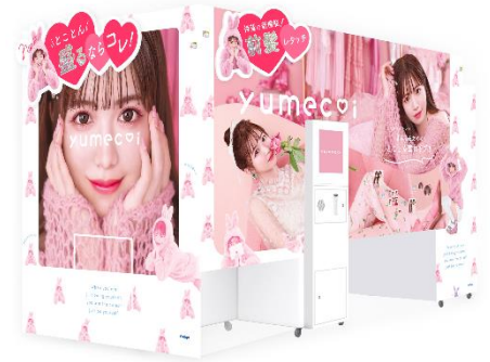
とことん可愛い世界観を 表現した外装