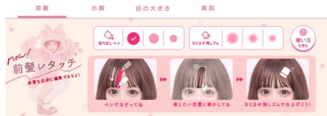
「前髪レタッチ機能」パレットイメージ