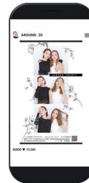
シールと同じデザインの画像もダウンロードできる