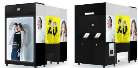
『AROUND20』外装イメージ(左:前面/右:背面)

モノトーン×黄色を基調に外観、ゲーム画面などをデザイン。また本体前面には巨大スクリーンを初搭載します。一目見ただけで、従来機とは異なる、スタイリッシュな世界観を感じていただけます。