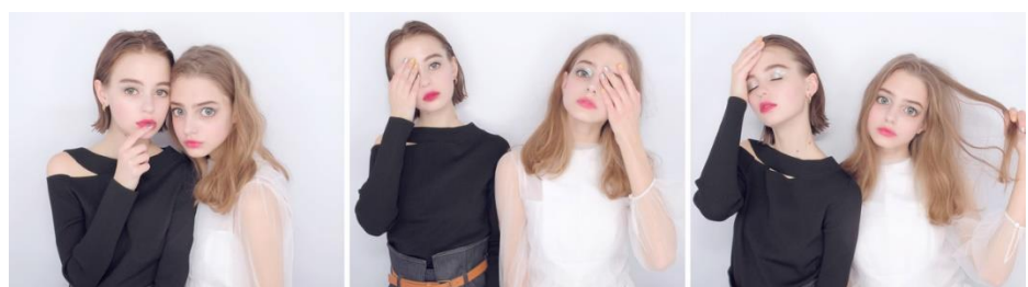
『AROUND20』の自然な写りを引き立てる、決めすぎないポーズ例