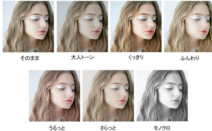
「写りセレクト」仕上がリイメージ一覧