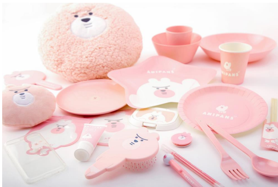
ダイソー×フリュー『GIRLS'TREND 研究所』“ANIPANS Series”商品イメージ

今回発売する“ANIPANS Series”は、フリューのオリジナルキャラクター、都会のアニパン島で暮らすパンツをはいた動物たち「ANIPANS」の商品化第1弾となります。商品は、ミラーやハンドクリームといった美容雑貨や大人気のスマートフォンケース、ふわふわとした質感が癒されるクッション、お出かけやパーティーで活躍する食器など、幅広いジャンルをご用意。「ANIPANS」の“共感系ゆるきゅん”な可愛らしさが満載のラインナップです。本商品は10月14日(日)に「ダイソー」イオンモール広島府中店にて先行発売し、10月20日(土)より全国の「ダイソー」にて順次販売いたします。