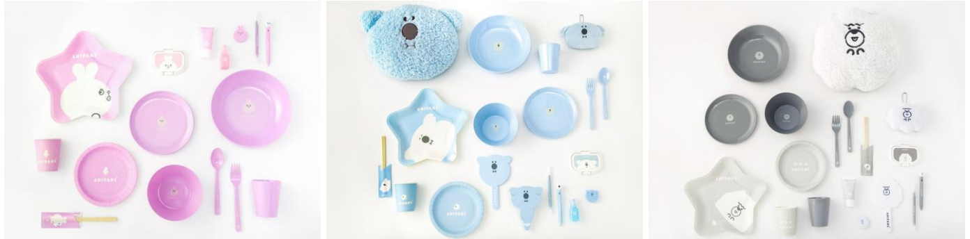
「ANIPANS」キャラクター別パリエーションイメージ