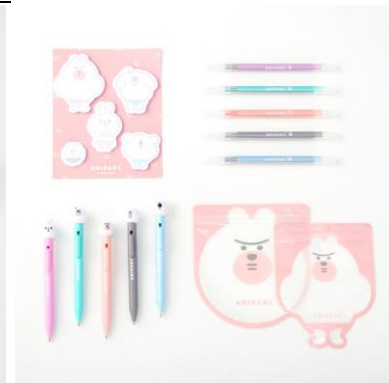
文具セットイメージ