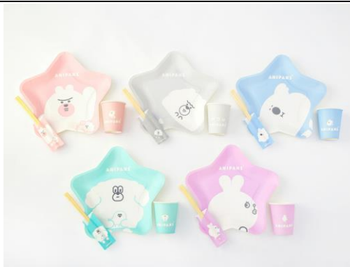
紙食器バリエーションイメージ