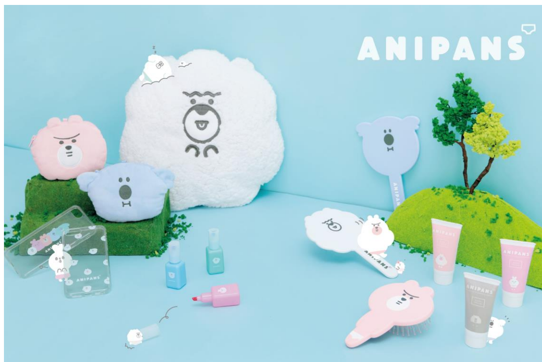
ダイソー×フリュー『GIRLS'TREND 研究所』“ANIPANS Series”商品イメージ

本コラボレーション(以下 コラボ)は2016年より開始し、2018年8月には累計販売総数が約3,600万個を突破。一部商品が売り切れる店舗も続出するなど、“安くてかわいい”と女子高生を中心に幅広い層の女性から注目を集めております。