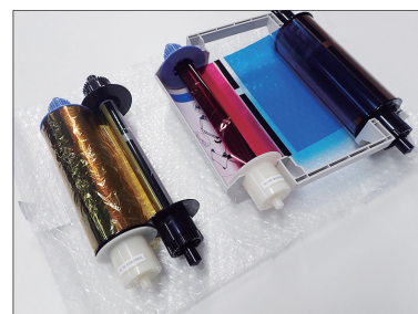
③包みの上でインクリボンを交換