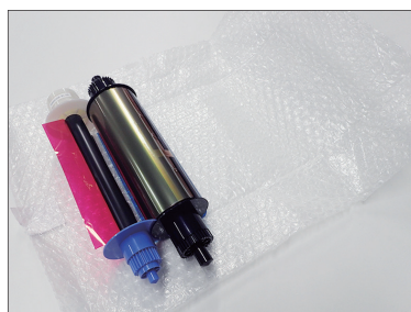
②新しいインクリボンを開封