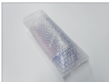
①新しいインクリボンを用意