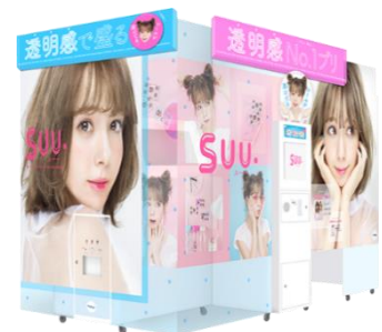
プリ機『SUU.』外観イメージ

プリ機『SUU.』プレスリリース http://www.puri.furyu.jp/allnews/press/suu_20180110/