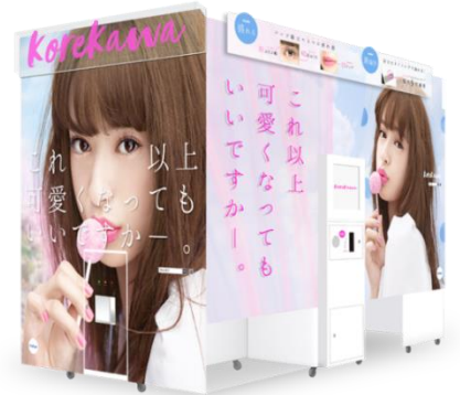
プリ機『コレカワ』外観イメージ