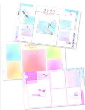
背景コンテンツ 例