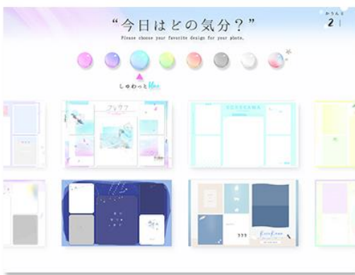
背景コンテンツ選択画面イメージ