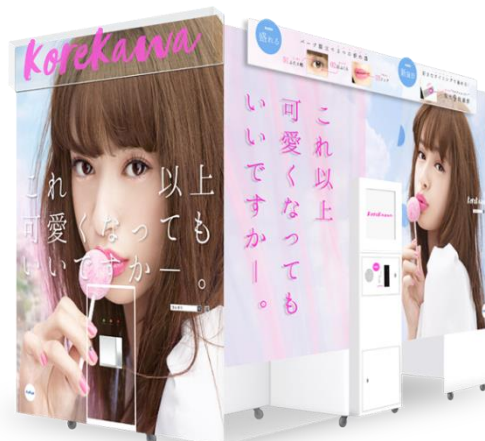
プリ機『コレカワ』外観イメージ

—二重の線の強調や追加で、“自然な二重”を表現 —「まる目」「たれ目」「ねこ目」から自分に似合うアイラインを選択可能