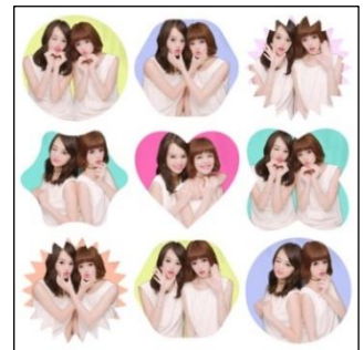
「プリちよこ動画」イメージ