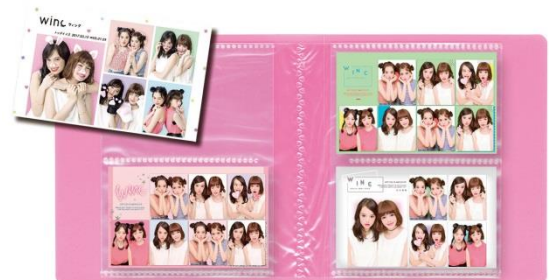
「ポケットプリ」カードファイル封入イメージ

なお、2017年2月1日(水)より順次発売予定の“ダイソー×フリー「GIRLS'TREND 研究所」”コラボレーション第3弾商品として、「ポケットプリ」の収納に適したカードファイルを販売予定です。