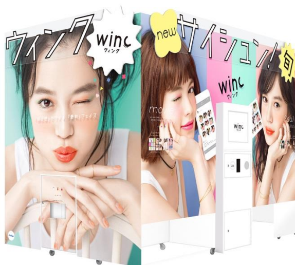
プリ機『winc』外観イメージ