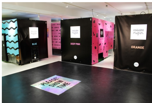
『collabo mignon(コラボミニョン)』店舗 イメージ