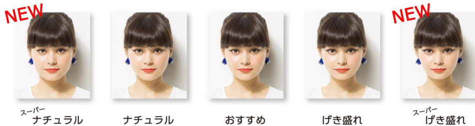
↑「R3」画像補正仕上がりサンプルイメージ

顔の大きさや目の大きさ、アイラインやまつ毛の濃さ、チークの濃さなどの強調具合が異なる仕上がりがイメージを5種類用意しました。前作までの3段階<ナチュラル・おすすめ・げき盛れ>に、より自然な仕上がりの<スーパーナチュラル>とより小顔でより目が大きく強調される<スーパーげき盛れ>が加わり計5段階から選択可能となりました。