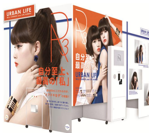
↑プリントシール機『R3』本体イメージ