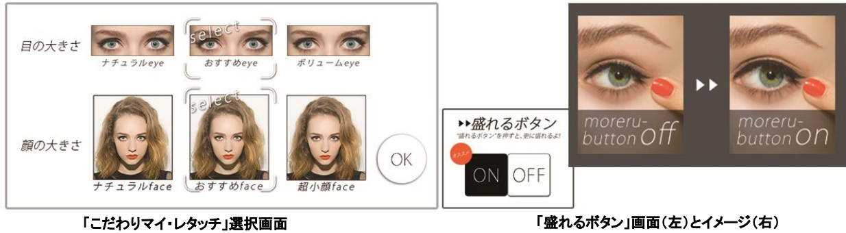
「こだわりマイ・レタッチ」選択画面

目と顔の大きさを、ユーザーが1人ずつに選択できる機能が進化を遂げ、「こだわりマイ・レタッチ」へ。瞳やアイラインの濃さ・まつ毛のボリュームが選べる「盛れるボタン」を新搭載し、より自分好みの顔の写りを追求できるようになりました。思いのままの仕上がりを楽しめます。