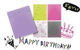
「プロフセレクト」シーケンスイメージ