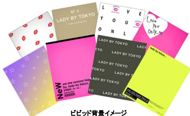
ビビッド背景イメージ