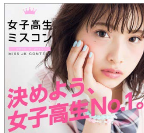
女子高生ミスコン