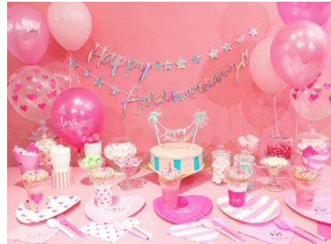
DAISO x GIRLS'TREND 研究所