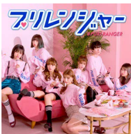
プリンレンジャー

若年女性に対する企画力、マーケティング力を活かし、プリ機キャンペーンや店舗イベントなど、フリーユース世代の女の子をターゲットとする多数の企業様とのコラボ実施や、幅広いジャンルの「女の子向けビジネス」を展開しています。