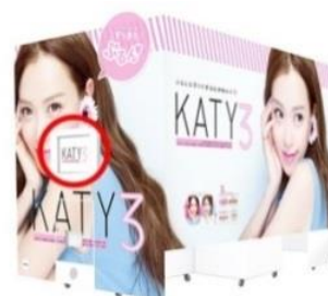
左から『SALON AIR』、『Cyun't2』、『KATY3』の外観イメージ 動画は赤丸部分の「外付けモニター」にて放映いたします