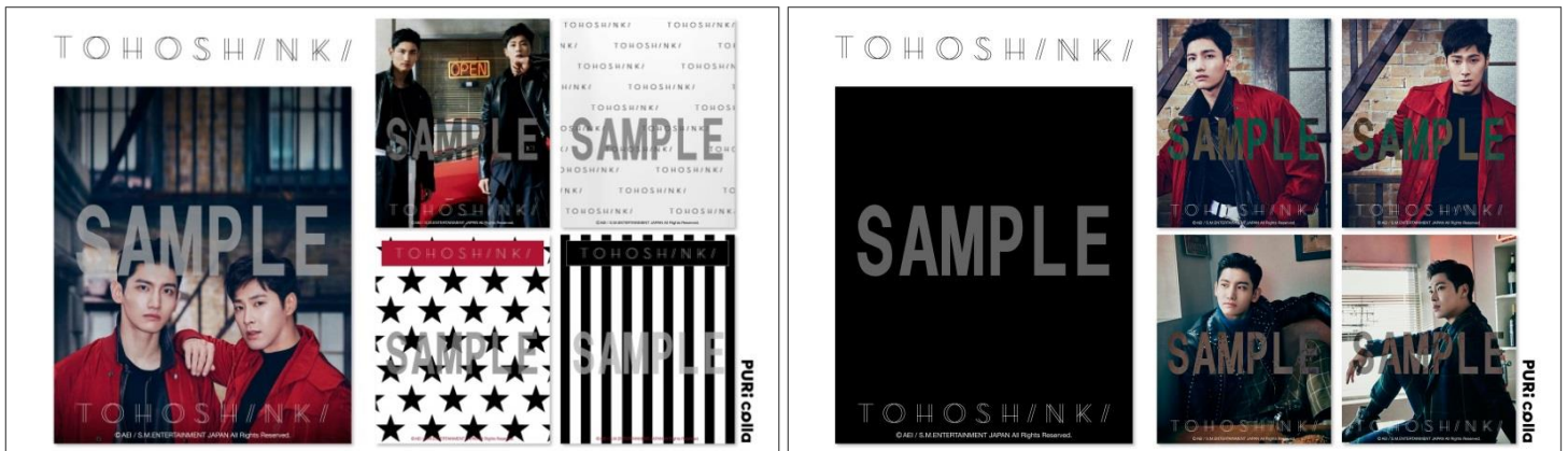
コラボ撮影フレームイメージ

[価格] 1 プレイ 400 円(税込、出荷時設定) ※プレイ料金は店舗により異なる場合がございます。