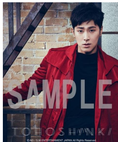
コラボ撮影フレームイメージ(11月11日より搭載)