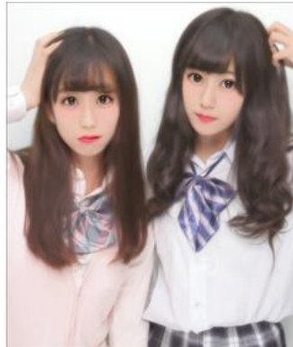
【頭痛ポーズ】 頭に手を当て、見る人の視線を 頭部にひきつける