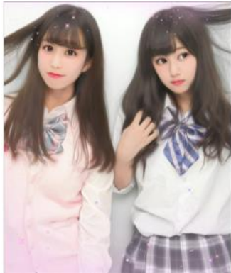
【髪ふわポーズ】 髪のをつまんで持ち上げ、 髪の繊細さや質感を際立たせる