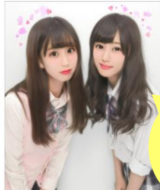
【前屈ポーズ】 ストロボの光がより多く当たるよう 上体をやや前かがみにし、 髪をより艶やかな印象に仕上げる